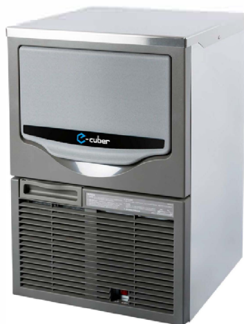
► SRM-40A - 1M6_

Largura x Profundidade x Altura 500mm (W) x 610mm (D) x 750mm (H)